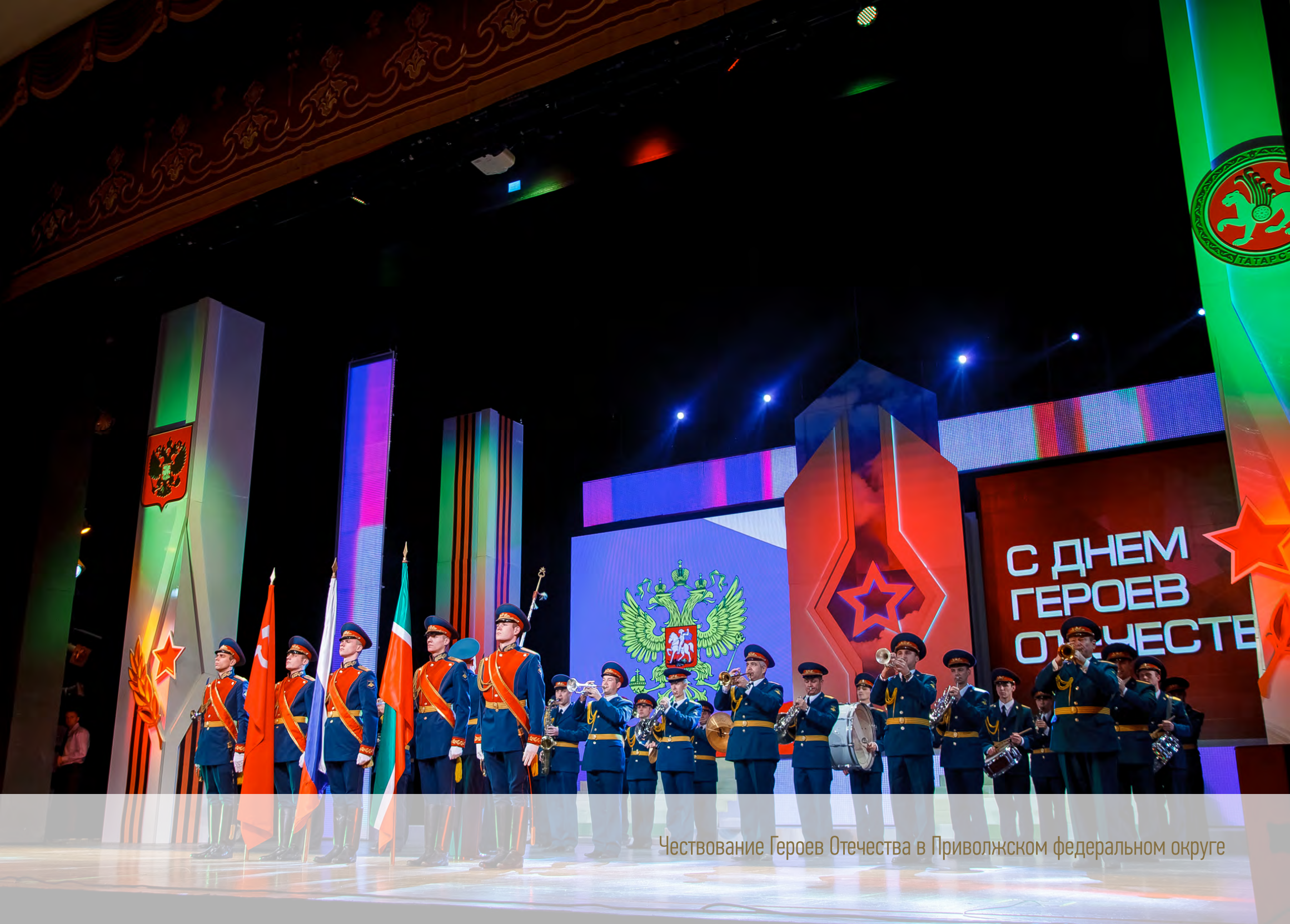
Чествование Героев Отечества в Приволжском федеральном округе