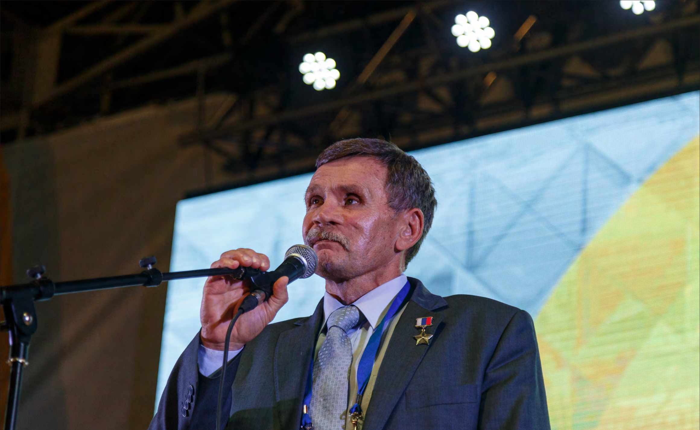
Герой России Вячеслав Бочаров на Молодежном форуме «iВолга - 2018»