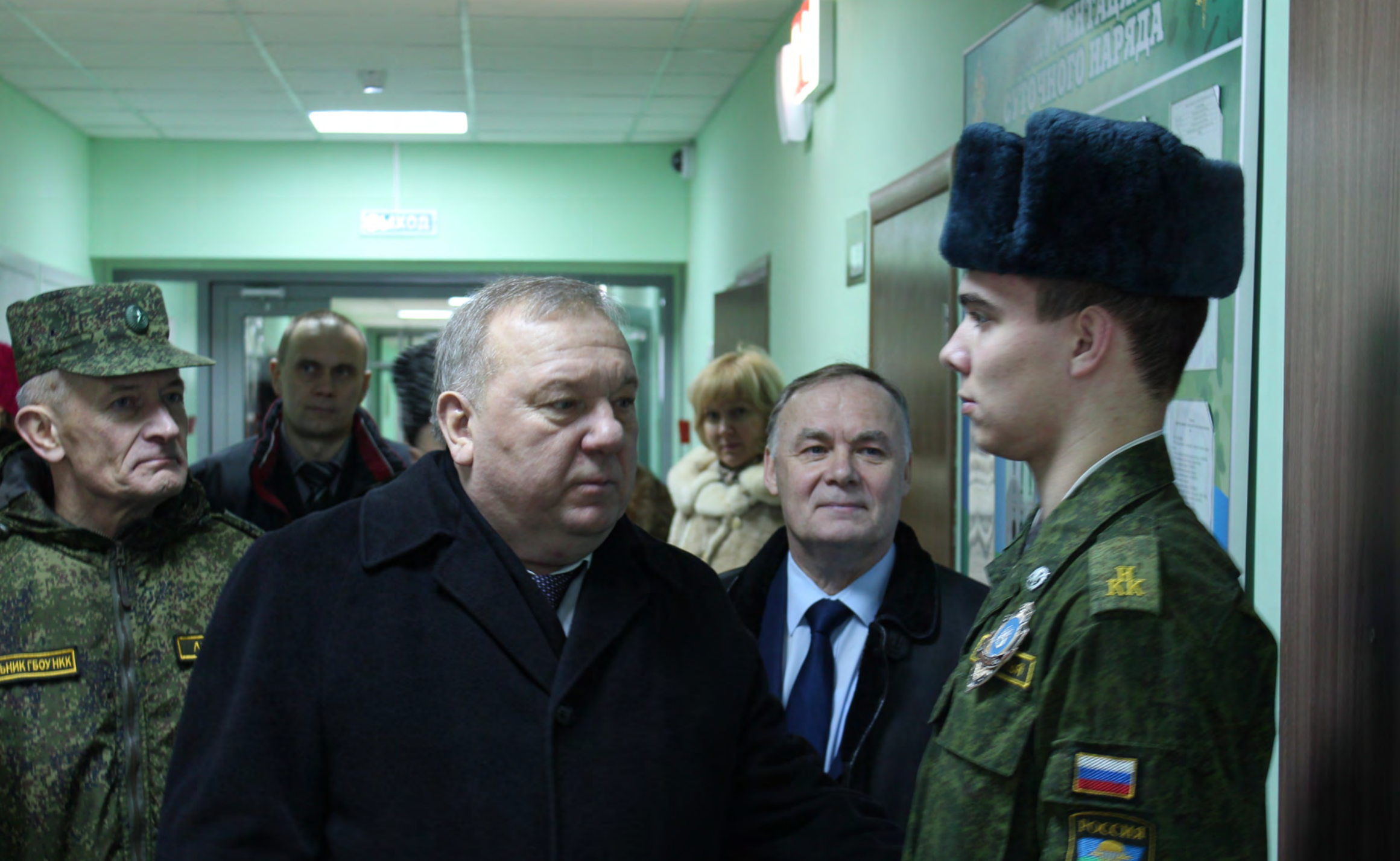
Герой России Владимир Шаманов в Нижегородском кадетском корпусе