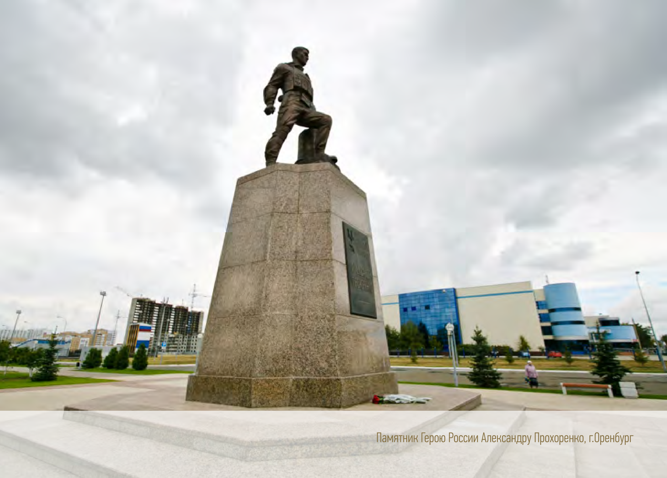
Памятник Герою России Александру Прохоренко, г.Оренбург